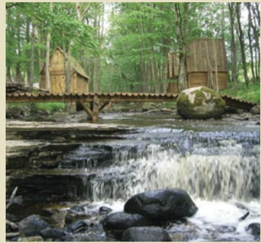
Forsviksmiljö ur filmen.

I Forsvik bygger Arn upp ett hantverks- och ett handelscentrum. Med uppkavlade armar, sida vid sida med trälarna sliter han med sitt livsverk så svetten lackar. Arn Magnusson är en hängiven man med många drömmar. Han startar en skola som i generationer förvaltar hans kunskaper i stridskonsten. Forsvik vid Botten sjön har en sexhundraårig lång industriell historia med järnsmide, sågverk och mjölnartraditioner. I dag finns välbevarade industriminnen i spännande miljöer att besöka.